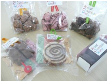
▲新発売のチョコレート。