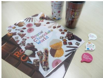
▲テーマカラーや、チョコレートをデザインしたオリジナルグッズ。

約 200 種類ある商品に新発売のチョコレートや、オリジナルグッズも加わり、さらに充実したラインナップでお客様をお迎えします。