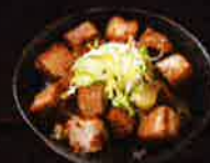
チャーシュー丼 Roasted Pork with Rice ¥300