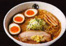
五子増しらーめん (味噌) Extra Eggs Miso Ramen ¥950