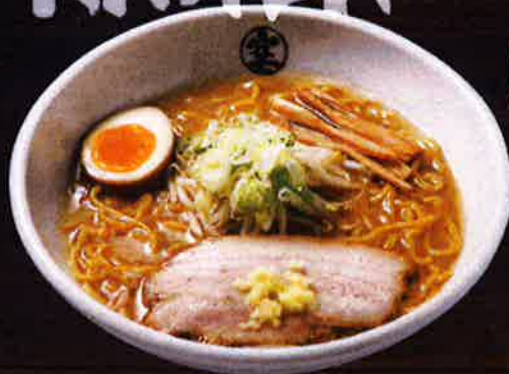
味噌らーめん Miso Ramen ¥850 [Soybean paste]