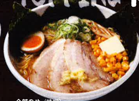
全部のせ (味噌) All Toppings Miso Ramen ¥1,250