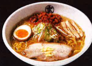
辛味噌らーめん Spicy Miso Ramen ¥900