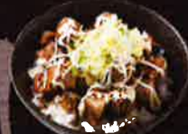
照りマヨチャーシュー丼 Teriyaki mayonnaise Roasted Pork with Rice ¥350