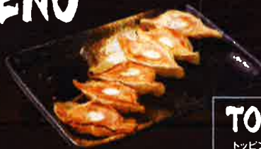
ギョウザ Gyoza ¥400