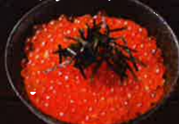
ミニいくら丼 Salmon roe with Rice ¥550