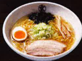
塩らーめん Salt Ramen ¥800