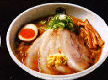
チャーシューらーめん (味噌) Extra Roasted Pork Miso Ramen ¥1,050