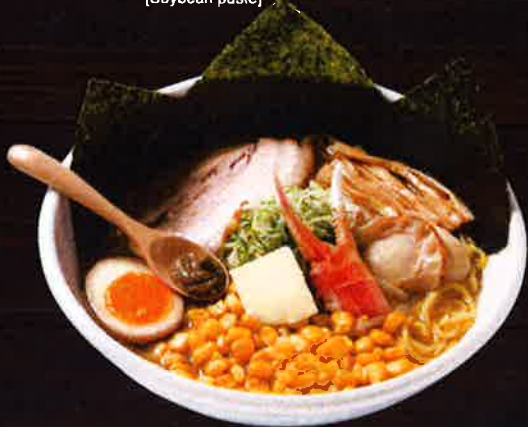
北海道贅沢グルメらーめん Hokkaido Epicurean Ramen ¥1,400