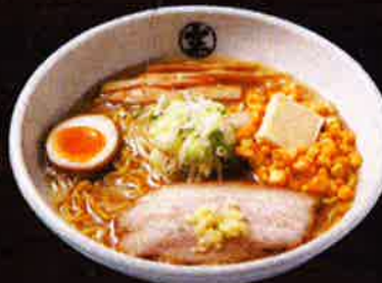
北海道バターコーンらーめん (味噌) Hokkaido Butter Corn Miso Ramen ¥980