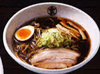
醤油らーめん Soy Sauce Ramen ¥800