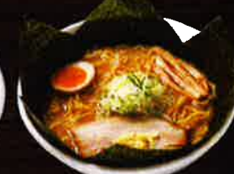
のり増しらーめん (味噌) Extra Roasted Seaweed Miso Ramen ¥950