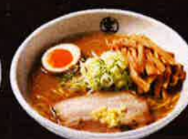
メンマ増しらーめん (味噌) Extra Bamboo Slices Miso Ramen ¥950