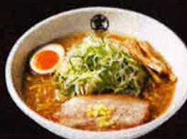
ネギ増しらーめん (味噌) Extra Leek Miso Ramen ¥950