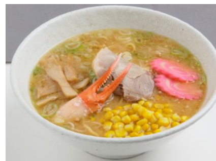
特製ちとせラーメンNO.1（870円）